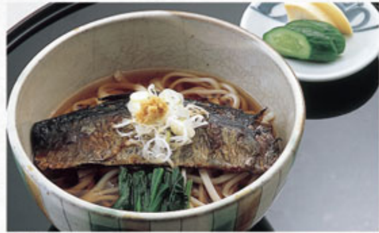
にしん 鯨うどん ..... 864円 (税込) (本体800円)