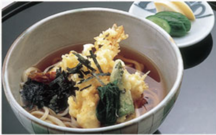
天麩羅うどん ..... 1,080円 (税込) (本体1,000円)