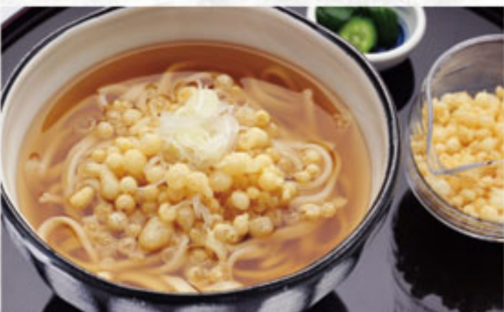
ためきうどん ..... 756円 (税込) (本体700円)