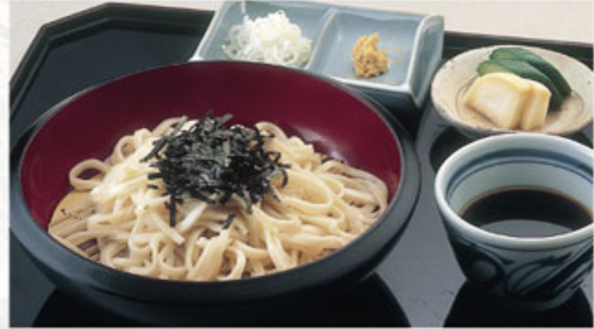
ざるうどん ..... 648円 (税込) (本体600円)