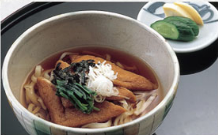
きつねうどん ..... 864円 (税込) (本体800円)