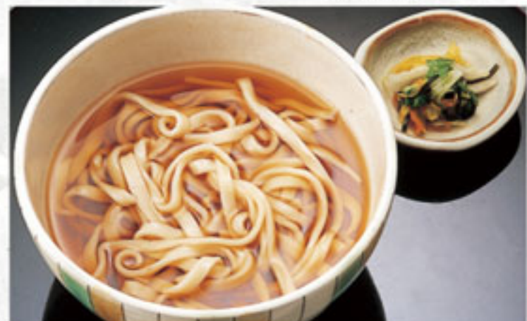
かけうどん ..... 648円 (税込) (本体600円)

・大盛りは216円増しとなります。・ご希望により、柔らかめ・堅めにも茹であげます。