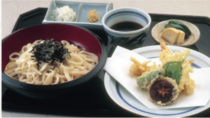
天ざるうどん ..... 1,188円 (税込) (本体1,100円) (季節により天ぷらの内容が変わる場合もございます)