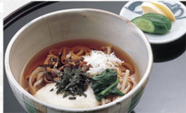
きのこうどん ..... 864円 (税込) (本体800円)