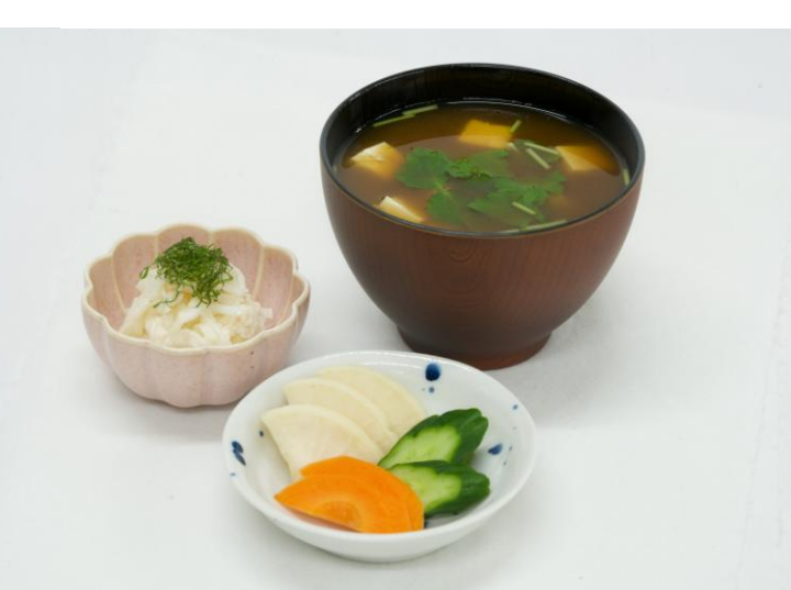
赤だしセット（季節の小鉢・漬物付）320円